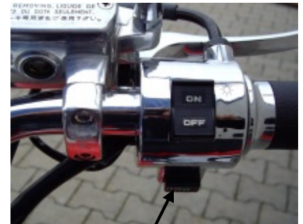
Zündschalter / Startknopf

Position: es sind sämtliche Leuchten ausgeschaltet